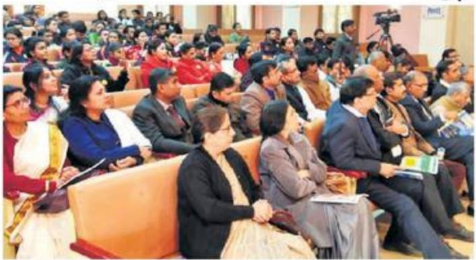
गालव सभागार में राष्ट्रीय सम्मेलन के समापन पर मौजूद अतिथि और प्रतिभागी।