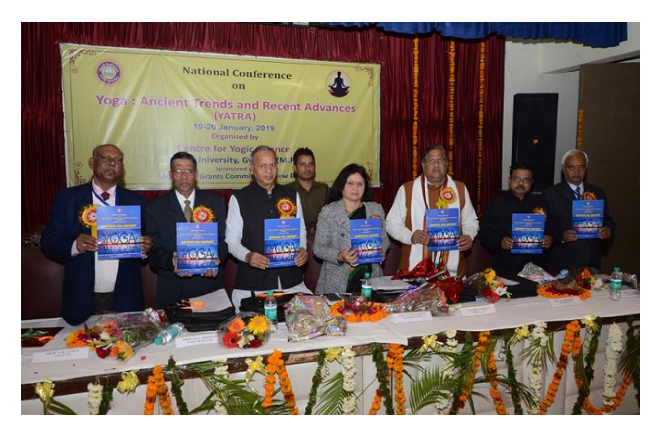
Dignitaries on the dais releasing Souvenir-cum-Abstract booklet.